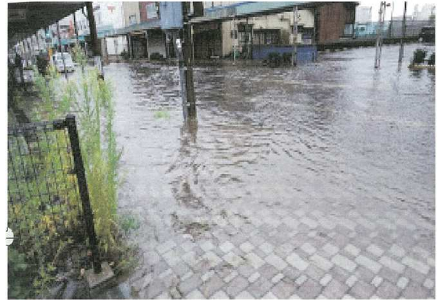
・歩道より郵便局方向