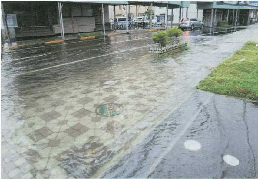
・歩道より(正面は朝日生命ビル)