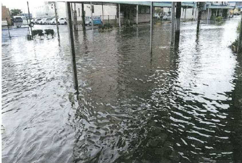
・アパート下より(右方向が駅)